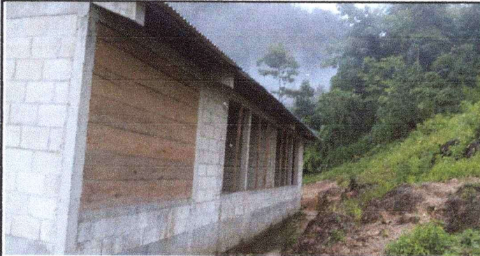
Foto 1: Se observa que las ventanas se encuentran en una mala condición.