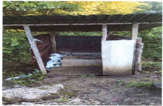
Foto 4: Se observa que a la parte interior del baño no se encuentra en buen estado.