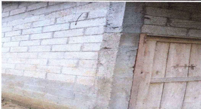
Foto 3: Se observa que la pared de la escuela falta de repello dentro y fuera de la instalación.